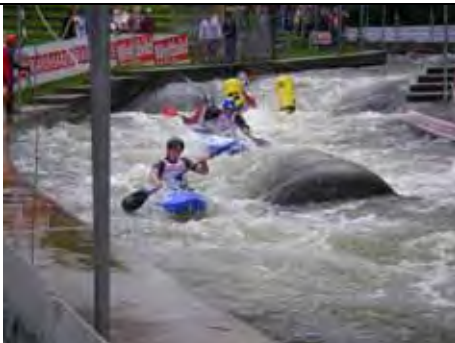
Neue Disziplinen beleben das Interesse. Cross boader canuing oder so ähnlich – irre! (Richtig: Boater Cross)