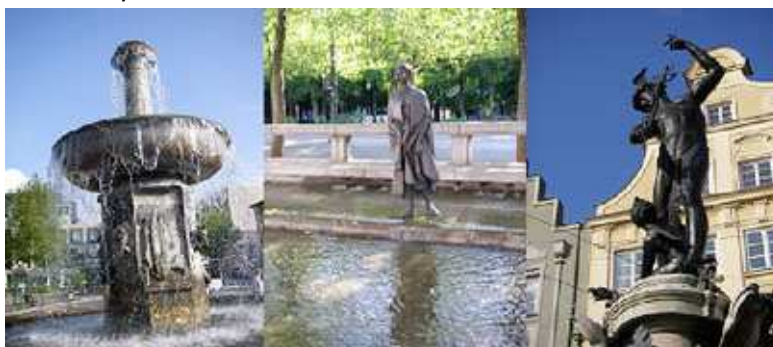
Augsburger Brunnenachse West-Ost

Das moderne Augsburg hat seit dem Bau des Bahnhofs eine neue West-Ost-Achse dazu gewonnen, die den Bahnhof mit der City-Galerie verbindet.